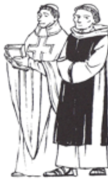
ceux qui prient :