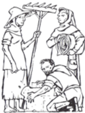
ceux qui travaillent :

moine, artisan, chevalier, paysan, seigneur, prêtre, marchand