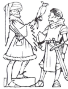
ceux qui combattent :