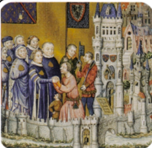
Le Duc Louis II de Bourbon reçoit l'engagement du seigneur de Bulle.