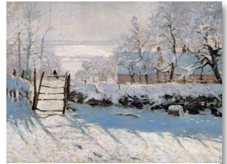
La pie (1869)