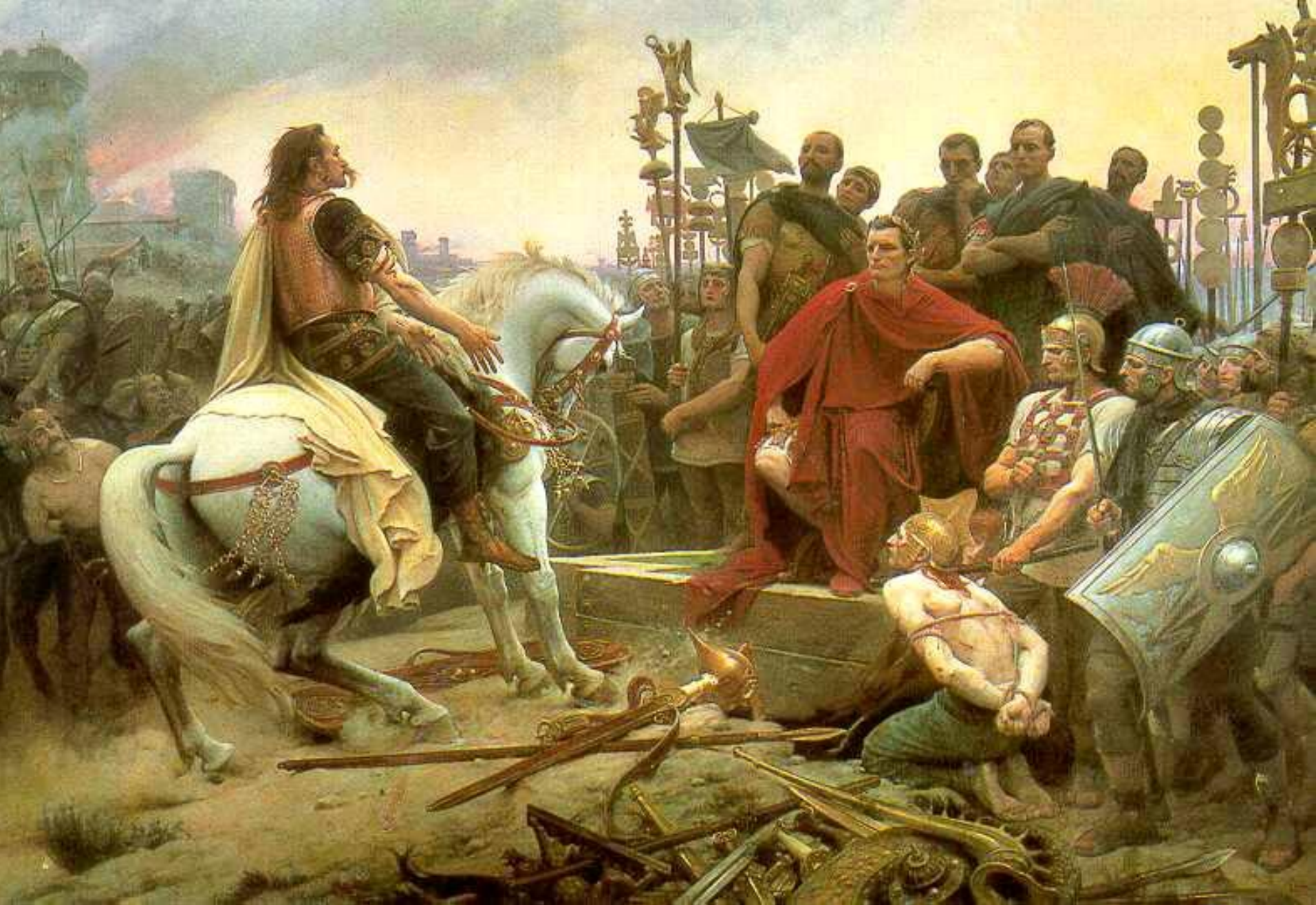
La reddition de Vercingétorix, peinture de Motte , XIX° siècle Musée Crozatier du Puy-en-Velay