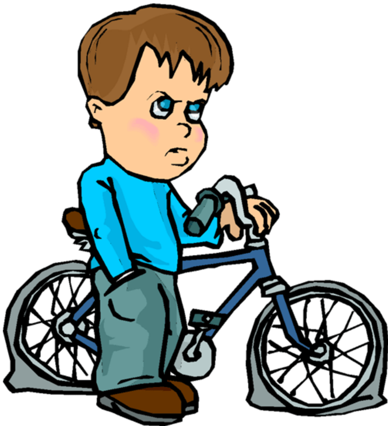
Illustration provenant de http://petit-bazar.unige.ch/