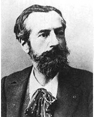
Auguste Bartholdi , concepteur de la statue de la Liberté.

Elle fut offerte par les Français pour célébrer le centenaire de la déclaration d'indépendance américaine et en signe d'amitié entre les deux nations. L'idée vient du juriste et professeur au Collège de France, Édouard Laboulaye en 1865. Le projet est confié en 1871, au sculpteur français Frédéric-Auguste Bartholdi qui fit appel à l'ingénieur Gustave Eiffel pour décider de la structure interne de la statue.