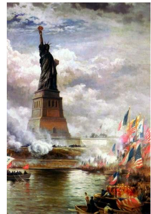
(L'inauguration vue par un peintre de l'époque).

L'inauguration de la statue fut célébrée le 28 octobre 1886 en présence du président des États-Unis, Grover Cleveland. Elle mesure alors 46,5 mètres de haut et 93 mètres de haut avec le socle. Ce monument, cadeau célébrant le centenaire de l'indépendance américaine, fut livré avec dix années de retard !