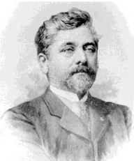
Gustave Eiffel , Ingénieur responsable de la structure interne de la statue.

Elle est officiellement offerte aux Etats-Unis à Paris le 4 juillet 1884.