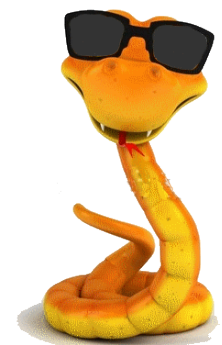
La Rolée du Touquet

* bigleux : Qui ne voit pas bien. (Langage familier)