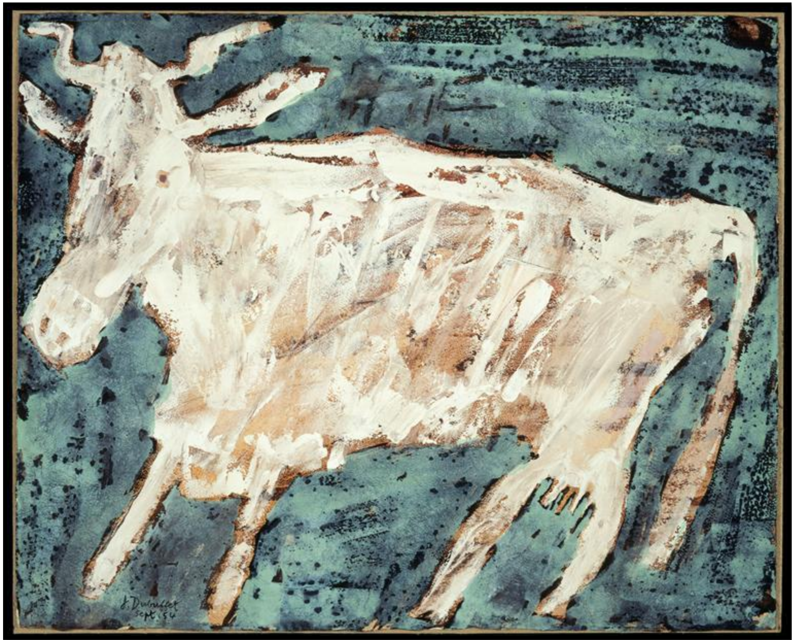
Vache blanche, fond vert, 1954