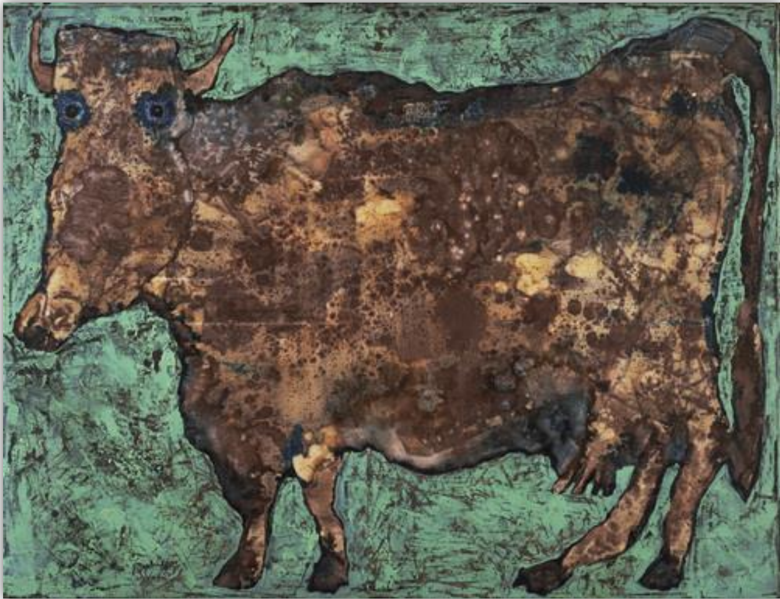
La vache au nez subtil, 1954