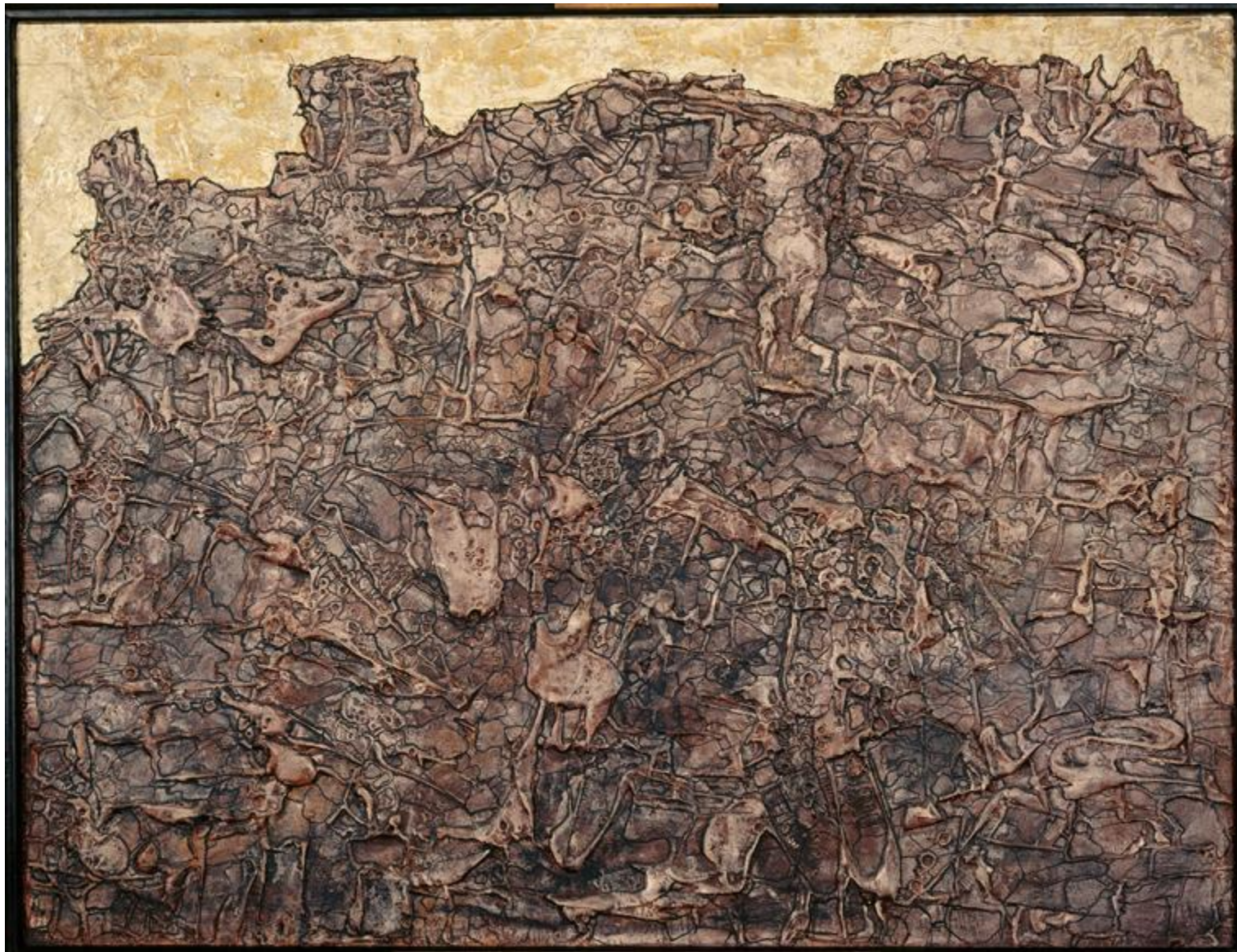
Le voyageur sans boussole, 1952