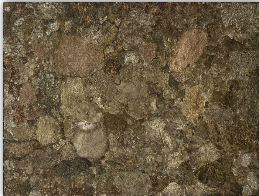
Soul of the underground, 1959