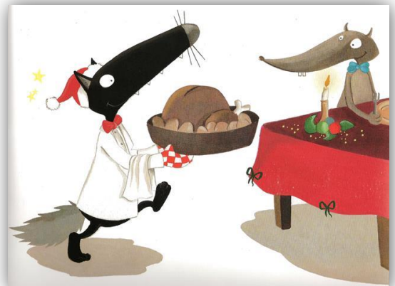
Le loup qui n'aimait pas Noël, Lallemand et Thuillier

Observe l'illustration d'un autre album et cherche un mot qui veut dire presque la même chose que « festin »: