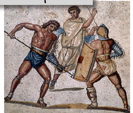
Combat de gladiateurs sur la Mosaïque de Nennig