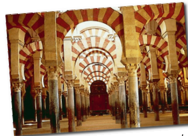
Salle de prière de la grande mosquée de Cordoue, Espagne.