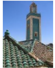
Minaret de Meknes, Maroc.