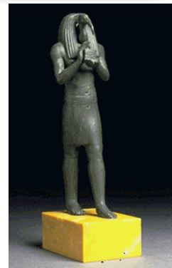
Avant d'écrire, les scribes récitait une prière à Thot, dieu sage, savant, l'assistant et le secrétaire (archiviste des dieux), qui est leur patron.