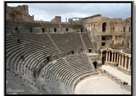
Le théâtre antique de Bosra