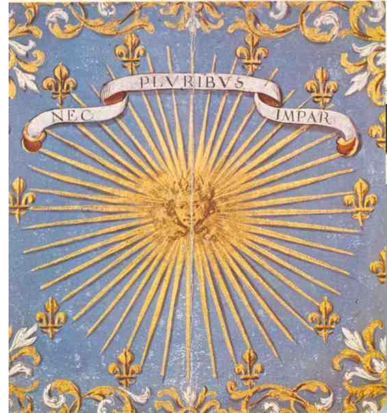
Soleil d'or sur fond d'azur semé de lys d'or.

La devise est en latin et signifie : Il en vaut plusieurs [il = le roi]